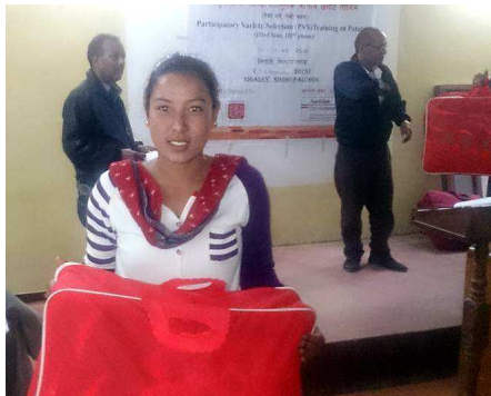
Uitdelen van de dekens tijdens een van de workshops over selectie van aardappels

Vanwege de aardbeving is dit project doorgeschoven naar 2017. Het is nu niet het juiste moment om te filmen in het kader van dit project. Dolakha,