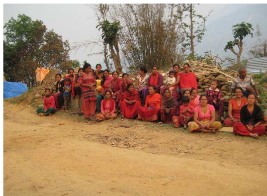
Vrouwen in Ditar, Ghorka zitten op de resten van hun gemeenschapscentrum.

Het restant van de opbrengst is nog niet uitgegeven, omdat dit bestemd gaat worden voor wederopbouw. Hiervoor zal vanuit Nepal eerst een gedegen plan gevraagd worden, zodat het geld ook echt besteed wordt voor structurele wederopbouw in de meest getroffen gebieden.