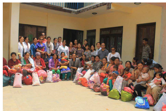
Groepsfoto van de vrouwen in Baktapur, die voedselhulp kregen